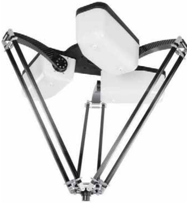
在应用项目中，如上所示的Delta机器人是由ControlLogix控制的。