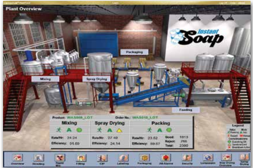
使用 Web 浏览器查看 FactoryTalk® View 画面。

“HMI 软件利用灵活的多功能可交互操作式平台和瘦客户端与其它平台连接的功能，推进工厂的可视化和智能化发展。FactoryTalk ViewPoint 能够满足这一要求，为用户提供其它用来访问车间重要数据的工具。” - ARC 顾问集团