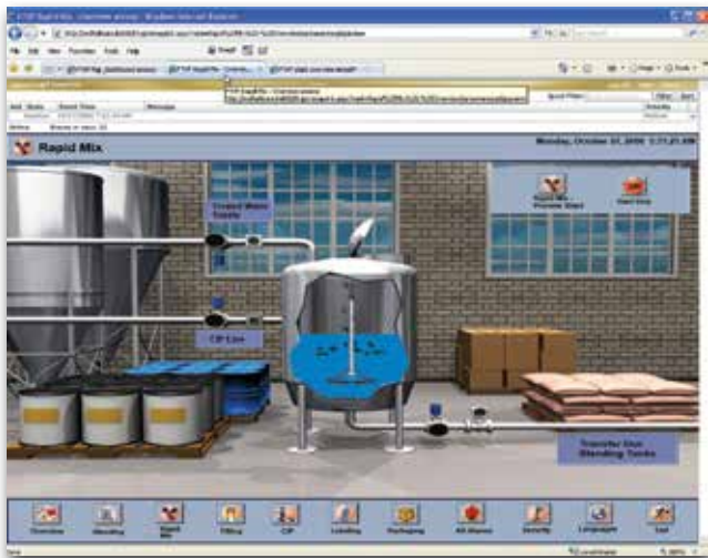
FactoryTalk ViewPoint 可与 FactoryTalk 服务平台全面集成，从而降低工程、运营和培训成本。